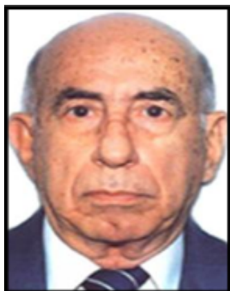
JOSÉ RAMÓN MACHADO VENTURA