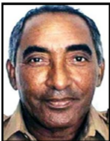
ARNALDO TAMAYO MÉNDEZ